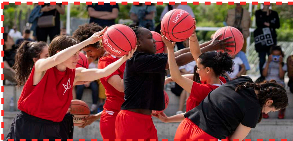
Photo de Timothée Lejolvivert // Equipe Rouge - MPAA Canopée le Halles le 15 Mai 2022

Au printemps 2022, Christina Towle, chorégraphe, a été invitée par le Carreau du Temple et le réseau MPAA - Maison des Pratiques Artistiques Amateur à concevoir un événement art et sport dans la continuité de sa création Bounce Back, quatuor chorégraphique mêlant danse contemporaine, basketball et musique électronique créé en 2021. Rebonds ! match chorégraphique explore donc le ballon de basket à travers de multiples possibilités : ballon de jeu sportif, mais également objet vecteur de mouvements dansés et percussion rythmique.