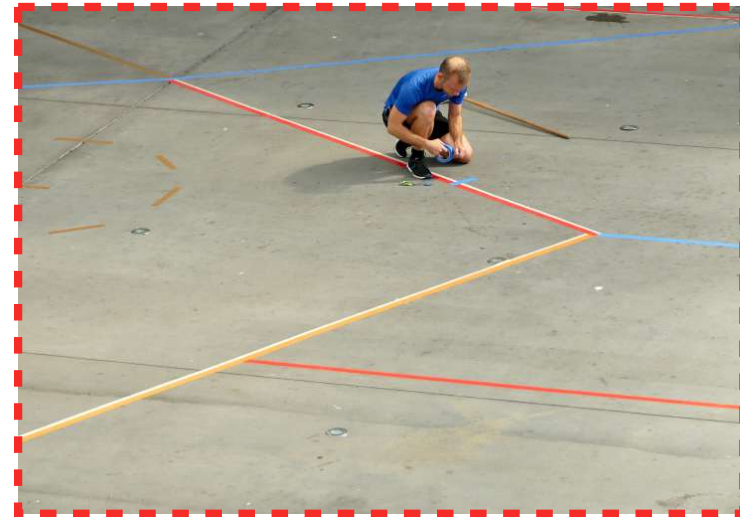
dessin du tracé scénographique

L'installation de ce tracé peut servir à la médiation autour de la performance.